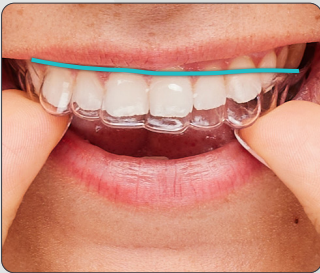
ClearCorrect design Hoog en recht

Ons unieke, bewezen design zorgt ervoor dat de behandelaar meer controle heeft over hoe je tanden bewegen tijdens de behandeling, wat er aan bijdraagt het doel te bereiken.